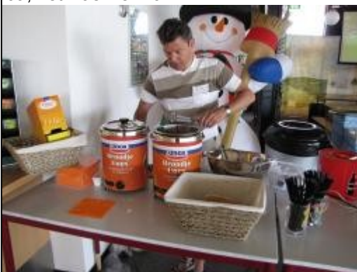
Ja, het was wel warm!