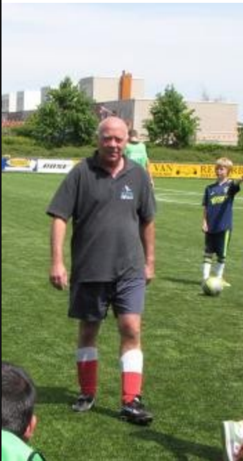
Ja Hans, valt niet mee!