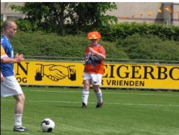
Kijk eens wat ik op m'n hoofd heb?