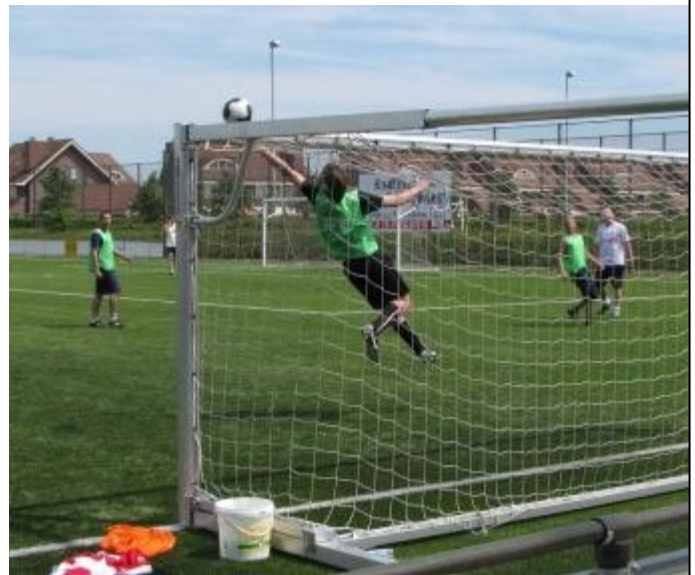
Opvolger van Stekelenburg?