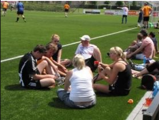
Tussendoor even bijpraten.