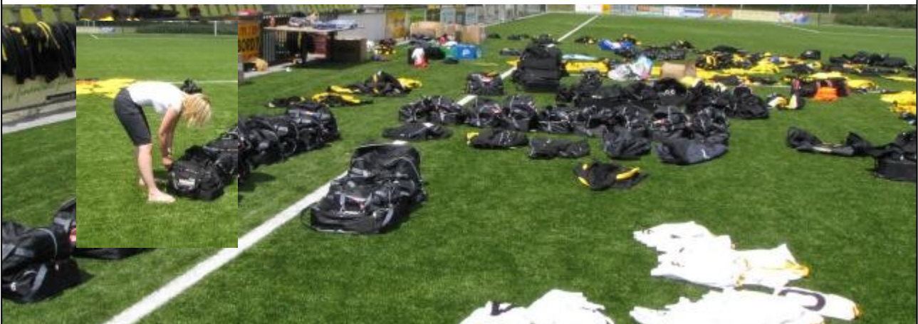
Foto beneden: Suzanne steekt natuurlijk ook de handen uit de mouwen (inzet).

Links: Robert controleert het materiaal op bruikbaarheid.