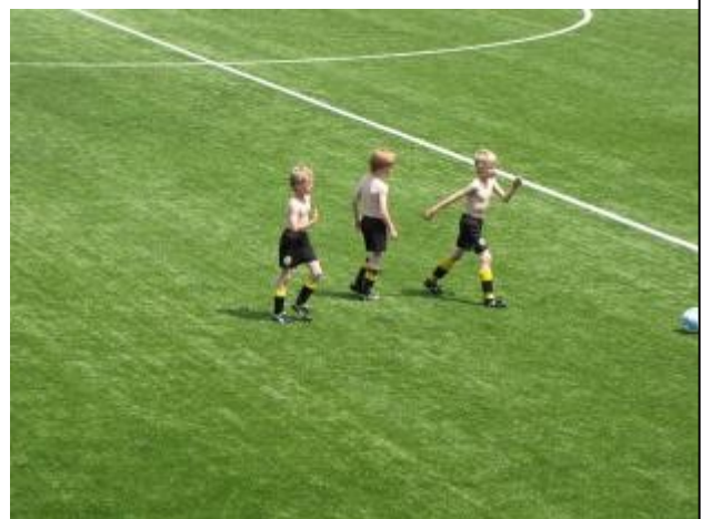
Reiger Boys in nieuw zomertenuue?