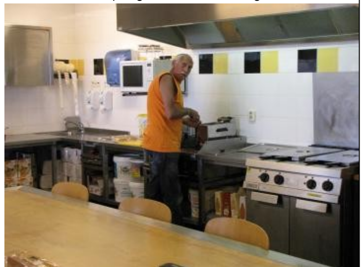
Ab houdt niet van voetbal, en Willem doet in "hot dogs".