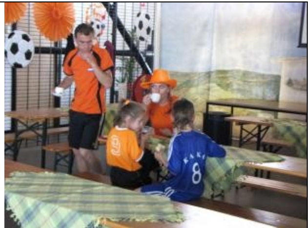
Koppie doen, glaasje fris...