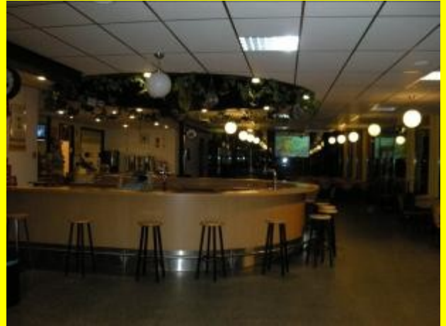
De kantine, zoals altijd keurig netjes verzorgd!