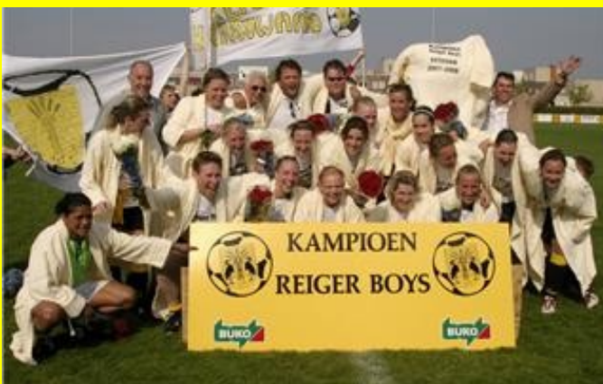
Dames 1 werd kampioen en promoveerde via de nacompetitie naar de hoofdklasse. Een prestatie van wereldformaat.