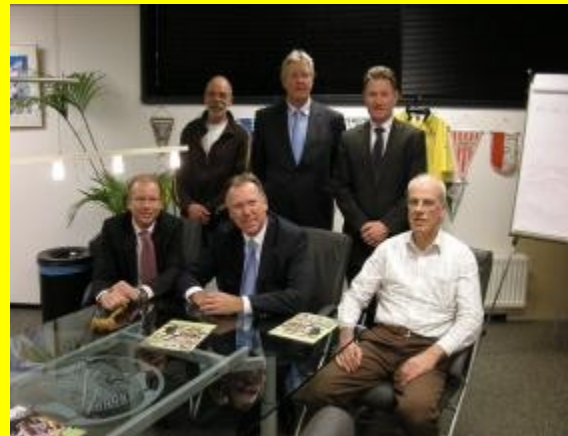
Bestuur Reiger Boys, februari 2007